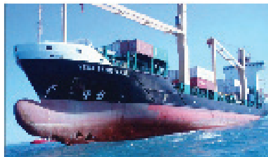
عکس توسط پلیس گرین‌لند، در گزارش «گزارش به حسابرسان دولتی در مورد تلاشهای دانمارک در قطب شمال»

در سال ۲۰۱۳، دیوان محاسبات دانمارک یک حسابرسی درباره تلاشهای این کشور در حوزه قطب شمال منتشر نمود. در این گزارش برای بصری‌سازی مشکلات شناسایی شده در حسابرسی، از تصاویر استفاده شد. برای نمونه، عکس زیر کشتی باربری را نشان می‌دهد که درست در خارج از ساحل گرین‌لند به طرف ساحل حرکت می‌کند. متن عنوان این عکس این بود: «در آگوست ۲۰۱۲، کشتی باربری زمانی که سعی داشت از توده یخ شناوری فرار کند، در محل ورودی گوتهاپسفورد به گل نشست. این قسمت، ریسکهای کشتیرانی در آبهای گرین‌لند را به تصویر می‌کشد. در نمودارهای دریایی، که برای ناوبری با استفاده از جی‌پی‌اس تایید شده‌اند، این حوزه پوشش داده شده، و این نمودارها روی کشتی قرار داشتند».