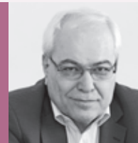
عضو شورای مدیریت مجله حسابرسی

بازار جهانی حضور پیدا کنیم. دلیل ورود به این راه آن است که با اقتصاد دنیا در ارتباط باشیم و از سرمایه‌گذاری بین‌المللی استفاده کنیم. من دو هفته پیش در جلسه کنفرانس سازمان بین‌المللی کمیسیونهای اوراق بهادار (IOSCO) شرکت کرده بودم. می‌توان گفت تمامی نهادهای ناظر بازار مالی دنیا در آن حضور داشتند. در آن کنفرانس رئیس هیئت استانداردهای بین‌المللی گزارشگری مالی مطلبی را ارائه کردند که جالب است: از ۱۳۸ حوزه (کشور) مورد بررسی، ۱۱۴ حوزه به‌طور کامل از استانداردهای بین‌المللی استفاده می‌کنند و ۱۲ کشور هم اجازه استفاده داده‌اند. بنابراین ۱۲ کشور هنوز استانداردهای بین‌المللی را نپذیرفته‌اند.